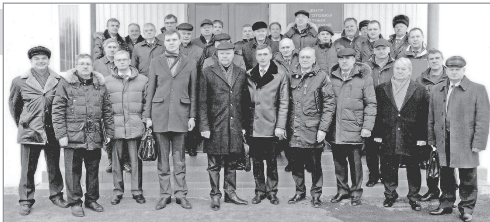
По информации ФКП «ГЛП «Радуга».

В соответствии с программой работы участники ознакомились с испытательной, аэродромной и полигонной базой ФКП «НТИИМ».